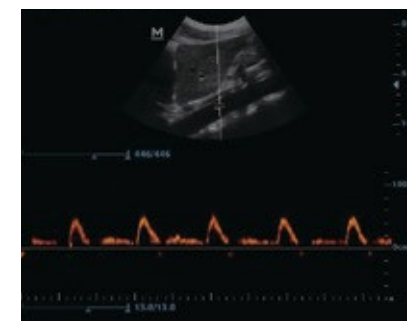
Imagen Doppler pulsado de la aorta