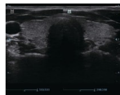
Tiroides de fusión dual