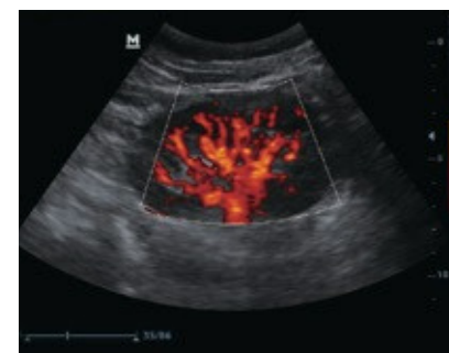
Imagen de poder del flujo renal