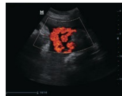
Imagen de poder del cordón umbilical